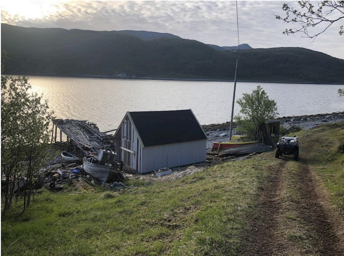
Et bilde fra før restaureringen.